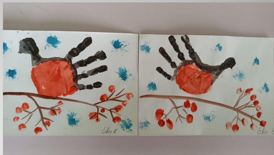
Рисование ладошкой "Снегирь"