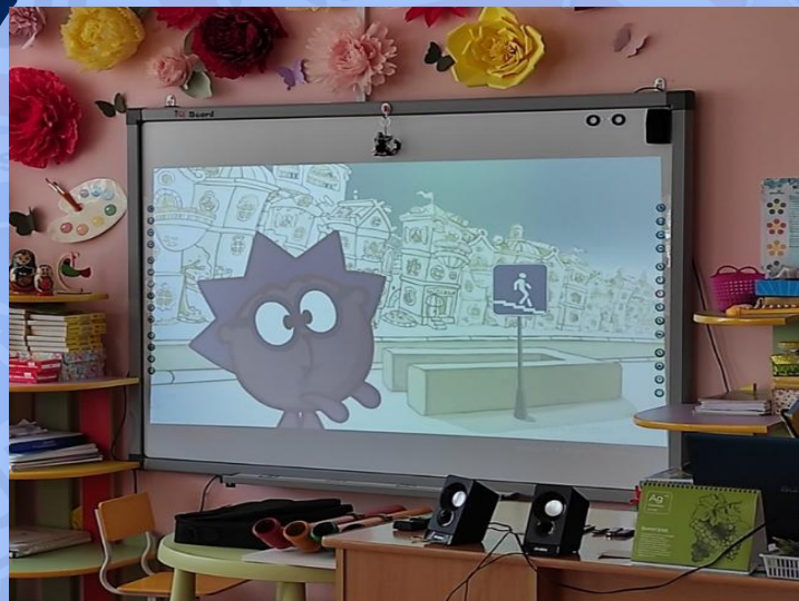
Просмотр мультфильмов по ПДД