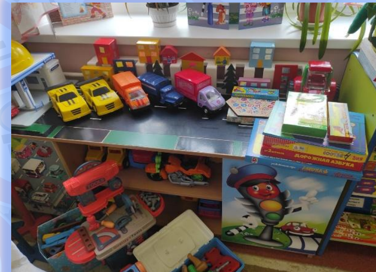
Знакомство с видами транспорта