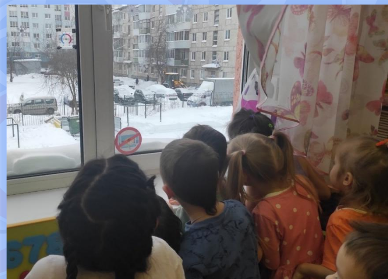
Наблюдение за работой бульдозера