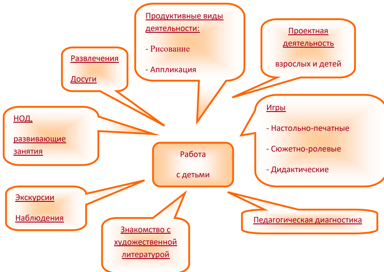
Рис.1 Формы работы с детьми по обучению безопасному поведению на дороге

Работа в ходе реализации программы может быть специально организована, а также внедрена в обычные плановые формы работы.